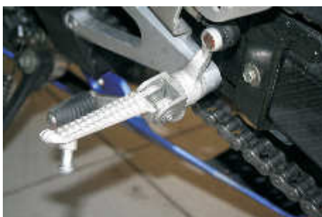
Beispiel Yamaha R1 (RN09)

The mounting of the replacement foot rests is then carried out as described. Our footrest kit then includes the appropriate replacement parts.